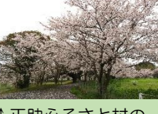
(↑正助ふるさと村の桜 4月4日撮影)

そのほか、吉武地区では、コミセン駐車場 武本公民館 久戸の公園 八所宮駐車場で満開の桜を見ることが出来ました!