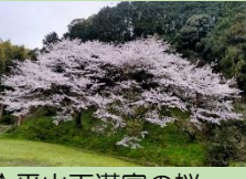
(↑平山天満宮の桜 3月31日撮影)