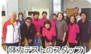
【体力テストのスタッフ】