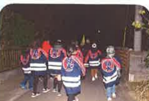
【おそろいの「防火」はっぴ】