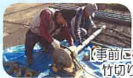
【事前に機械を使って竹切りをしました】