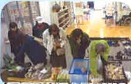
【ごころ会による野菜の販売も開催されました】