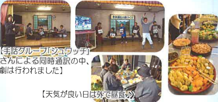
【手話グループ「シュワッチ」さんによる同時通訳の中、劇は行われました】