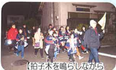
【拍子木を鳴らしながら「火の用心〜」】

12月21日(土)、自治会・保護者・教育大男子寮の学生さん(8人)、皆さまのご協力のもと「夜回り」を実施しました。大人と子ども合わせて47人で2グループに分かれて城南ヶ丘を回りました。「マッチ一本火事のもと」初めは恥ずかしくて言えなかった子ども、歩くにつれ大きな声で頑張りました。応援の声かけにもはげまされ、最後まで元気いっぱい無事に終わることができました。(城南ヶ丘子ども会 会長)