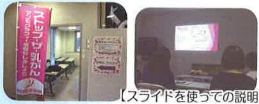
【スライドを使うでの説明】

検診や自己触診、早期発見の重要性を学びました。自己触診については、やり方は知っていましたが、「しこり」と言われてもピンと来ていませんでした。模型に触れることでよく理解できたのが良かったです。乳がん経験者の言葉は重みがあり気持ちも引き締まる思いでした。「若いから」「高齢だから」は関係なく、多くの人に参加していただきたい講座でした。(参加者より)