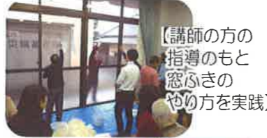
【講師の方の指導のもと窓ふきのやり方を実践】