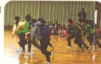
【カバンを背負って走るは大変】