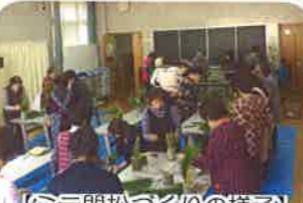
【ミニ門松づくりの様子】