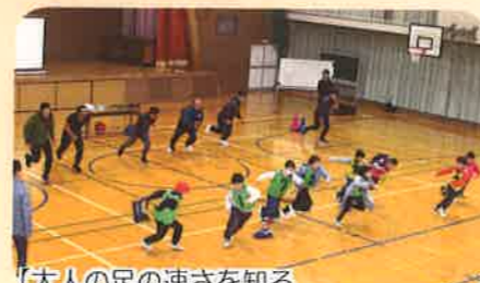
【大人の足の速さを知る ランドセルはその場に置いて逃げよう】