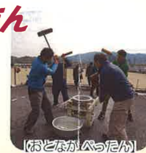
【おどながぺったん】

お天気にも恵まれた日曜日、防犯スポーツ教室で運動してお腹をすかせた後は、お待ちかねのおもちつきです。力強くもちをつくお父さん方、一生懸命におもちをつく子どもたち、みんな楽しそうにしていました。つきたてのおもちは、きなこ、みたらし、大根、ぜんざい、あんこ等でお腹一杯にいただきました。本当に美味しかったです。準備して下さった関係者の方々、どうもありがとうございました！ (参加した保護者より)