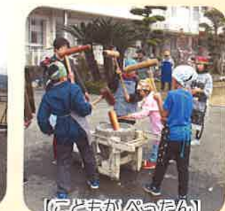
【こどもがぺったん】